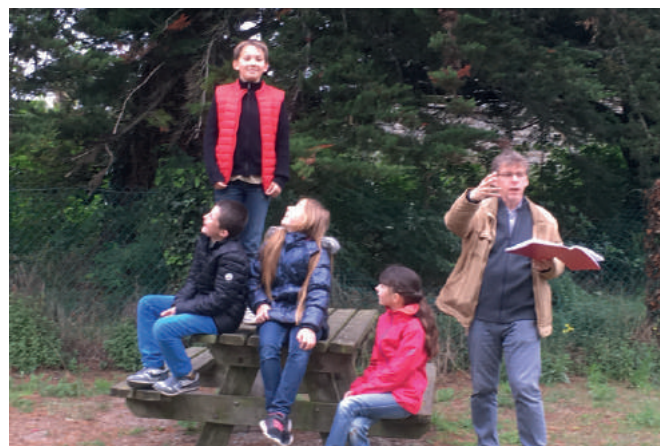
Préparation au tournage des Mystères de la presqu'île : répétitions en plein air