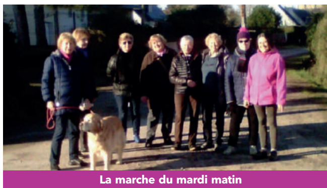
La marche du mardi matin