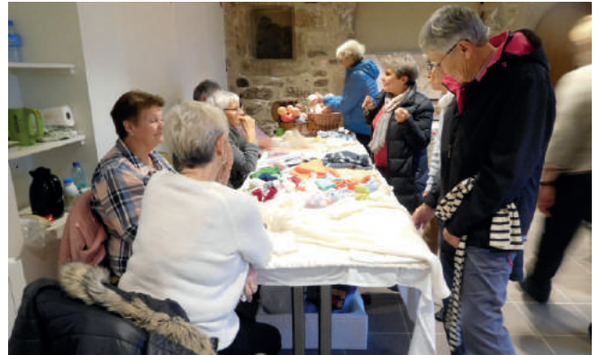
Exposition "Ouvrages de dames" du dimanche 2 décembre 2018.

Ce programme, ainsi que toutes les animations hebdomadaires et ponctuelles organisées dans les locaux du Centre culturel sont consultables sur le site du Centre associatif : www.centre-associatif-stjacut.fr .