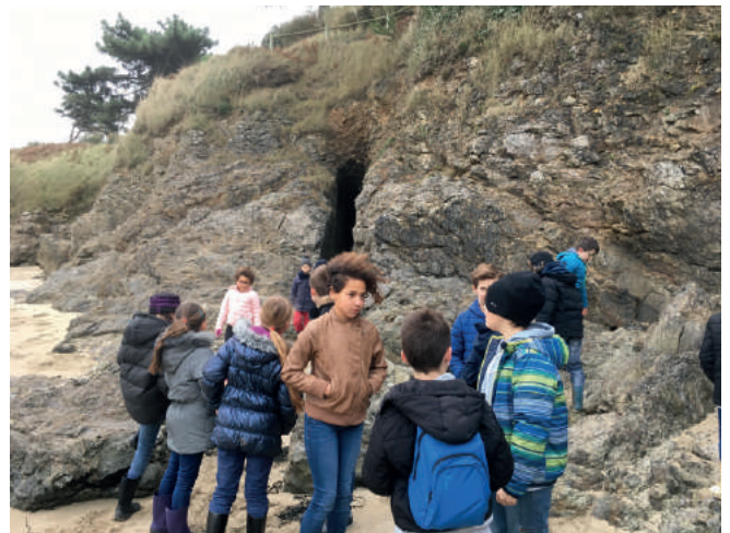
Exploration de la grotte de la Houle Causeul.