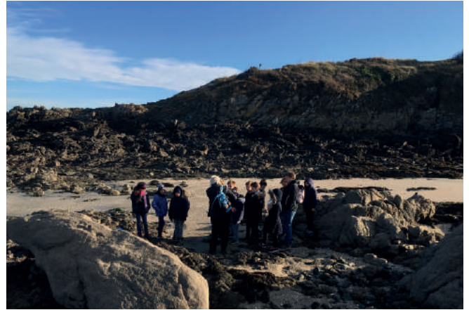
Sortie scolaire au Chef de l'Isle, à la découverte du menhir identifié par monsieur Duédal.

Le menhir, la tour des Ebihens, le rocher Saint-Awawa, la grotte de la Houle Causeul ou encore la « tête d'indien », les enfants ont fait preuve d'imagination pour faire partager leur découverte des sites les plus insolites de la presqu'île !