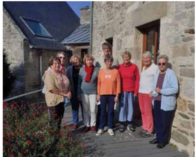
Les joueurs de scrabble en duplicate et cartes du mardi 19 octobre 2021.

L'activité du Club a repris en douceur au Centre culturel, de façon hebdomadaire :