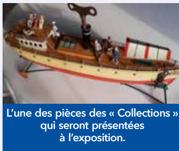
L'une des pièces des « Collections » qui seront présentées à l'exposition.

Une assemblée générale du Centre associatif et culturel se tiendra le lundi 13 décembre , ouverte à toutes les associations jaguines intéressées.