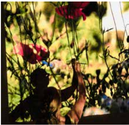
Dans l'atelier de Valérie Sonnier (août 2022)