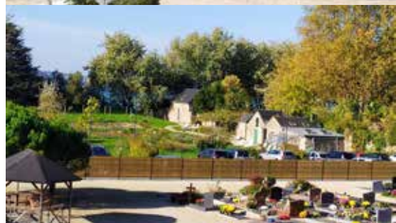
Mise en place d'une clôture occultante pour rajouter une rangée de concessions