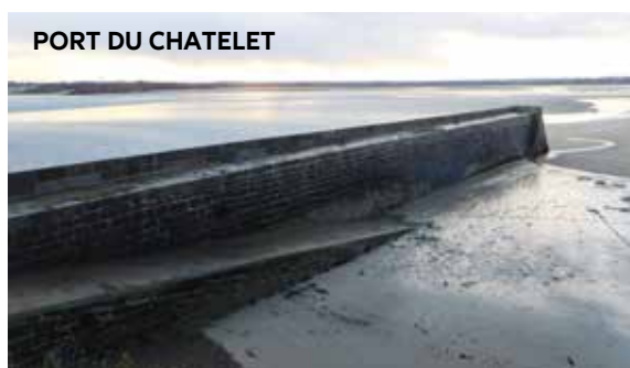
PORT DU CHATELET

Tous auront à cœur, comme la municipalité, de remercier et de féliciter l'équipe portuaire pour leur abnégation et leur professionnalisme.