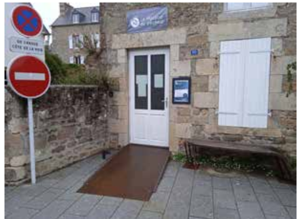
Accès PMR pour la Maison du Pêcheur

Sécurisation de la circulation devant l'école : installation de pots de fleurs pour le passage piéton et de plots devant l'ancienne caserne pour éviter le stationnement et les manœuvres dangereuses pour les enfants lors de la sortie d'école