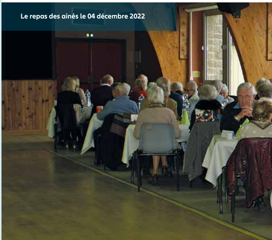
Le repas des aînés le 04 décembre 2022