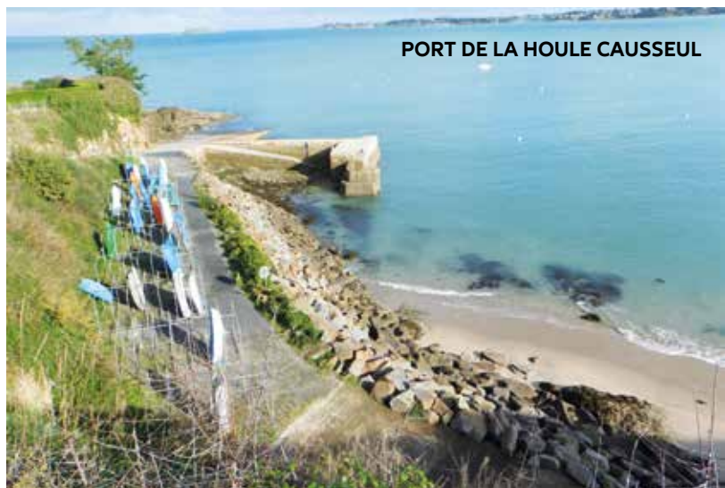
PORT DE LA HOULE CAUSSEUL

Enfin, la commission des mouillages, qui est chargée de l'étude des demandes et de l'attribution des places sera composée de 2 élus municipaux et du gestionnaire du port. Des travaux de maintenances et de réparations sur la cale sont prévus et devraient être réalisés au cours de l'année prochaine.